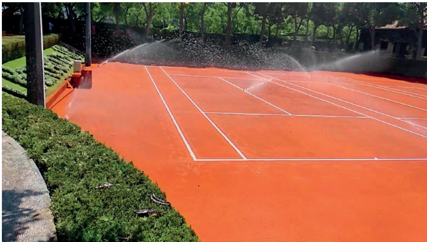
Real Club Tennis Barcelona.