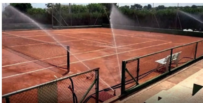
Club Tennis Carlet (Valencia).