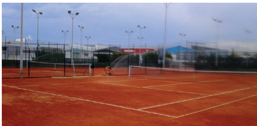
Club Tennis Almasora (Castellón).