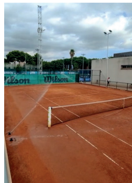
UP Club Cornellà. Barcelona (Tomás Carbonell).