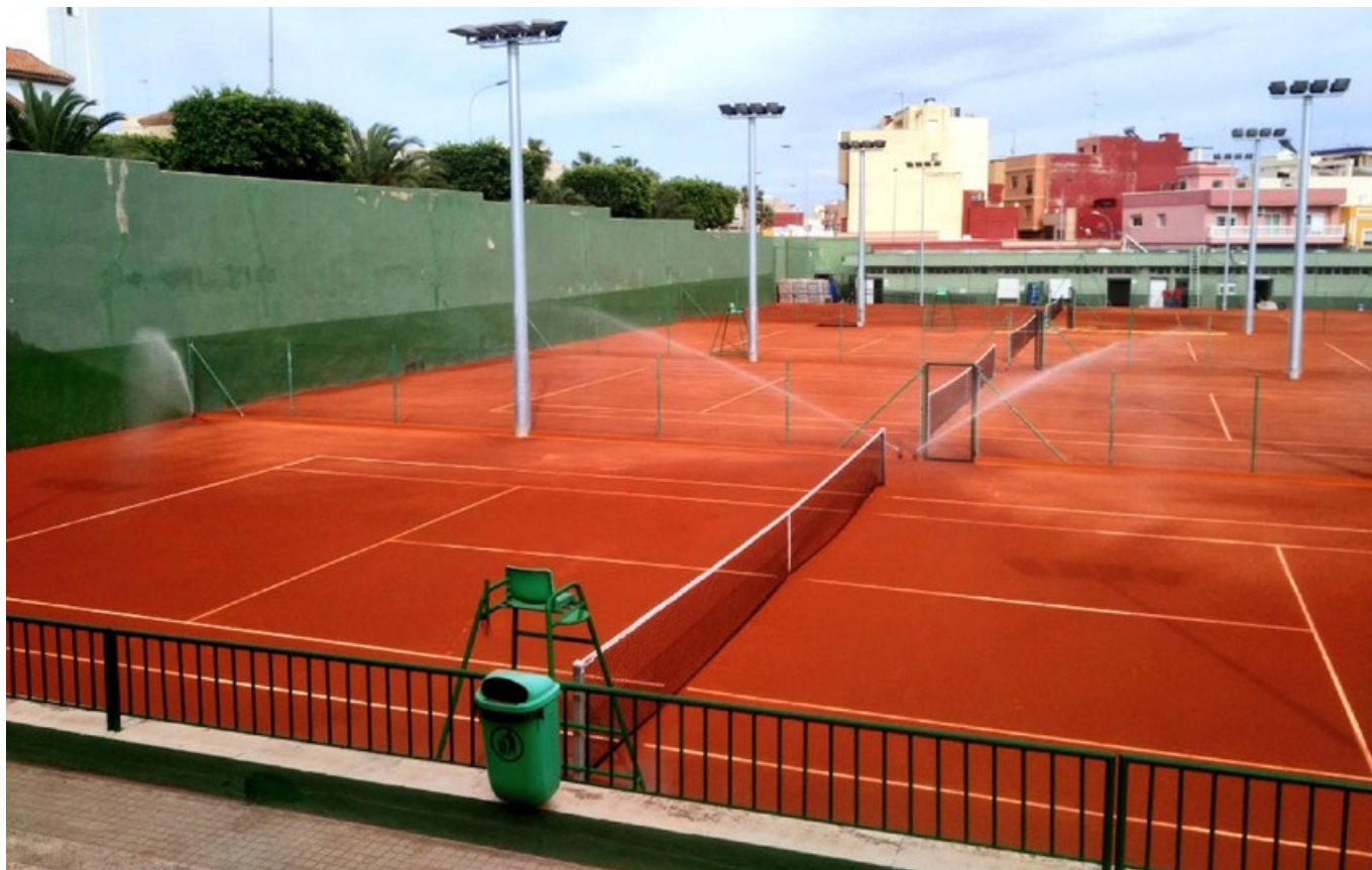
Federación Melillense de Tenis.

Las pistas de tierra batida para mantener la humedad adecuada precisan de un riego periódico. Es por ello que además del sistema de riego manual, CELABASA aconseja un sistema de riego automático por aspersión especialmente diseñado para las pistas de tenis que se controla desde un programador electrónico al que se puede acceder opcionalmente desde el ordenador o del teléfono móvil.